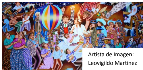
Artista de Imagen: Leovigildo Martínez